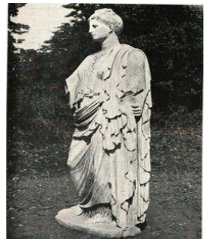
DEA DI BUTRINTO